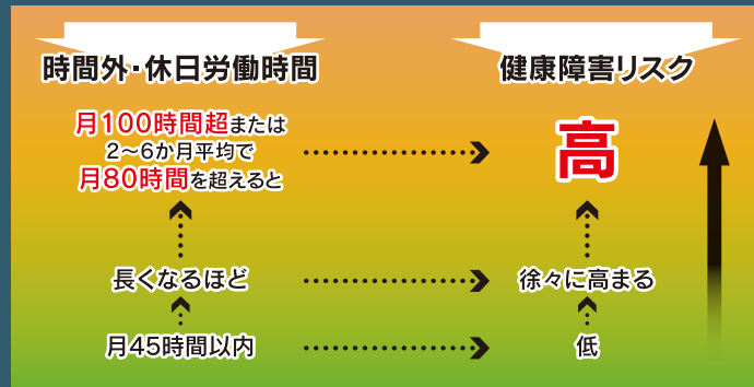
過重労働と健康リスクとの関連性

(右の図は、労災補償に係る脳・心臓疾患の労災認定基準の考え方の基礎となった医学的検討結果を踏まえたものです。)